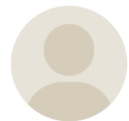
岩手県庁コロナ対策室

軽症～中等度患者モニタの目的で「Hachi」を導入していますが、医師や医療スタッフの入院患者様への接触を必要最低限としながら、各種バイタルの推移がリモートで簡単に確認できることで、院内クラスターの予防やバイタル計測の手間軽減などにつながり、重宝しています。