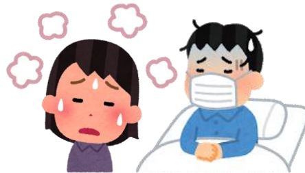
療 養 施 設 利 用 者 自 宅 療 養 患 者