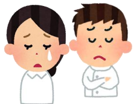
看 護 者 保 健 師